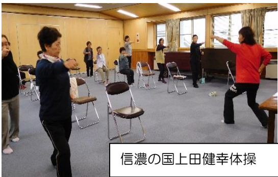
信濃の国上田健幸体操

参加者の声 「歩いて来られる場所で運動できてうれしい。これからも参加したいです。」 「みんなに会えるのが楽しみ。体が軽くなって動きやすくなりました。」